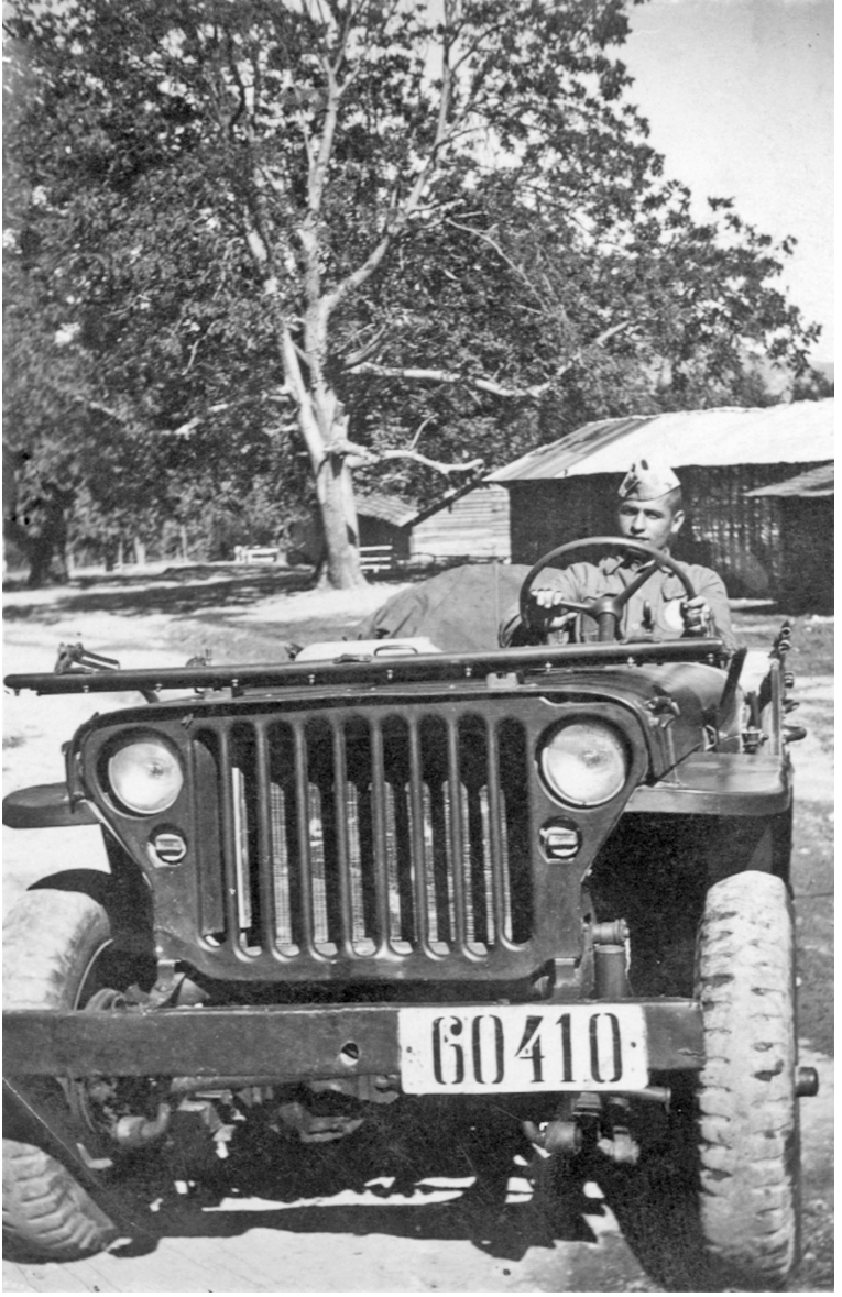
Hacı Kemal Erimez'in bir askerlik hatırası