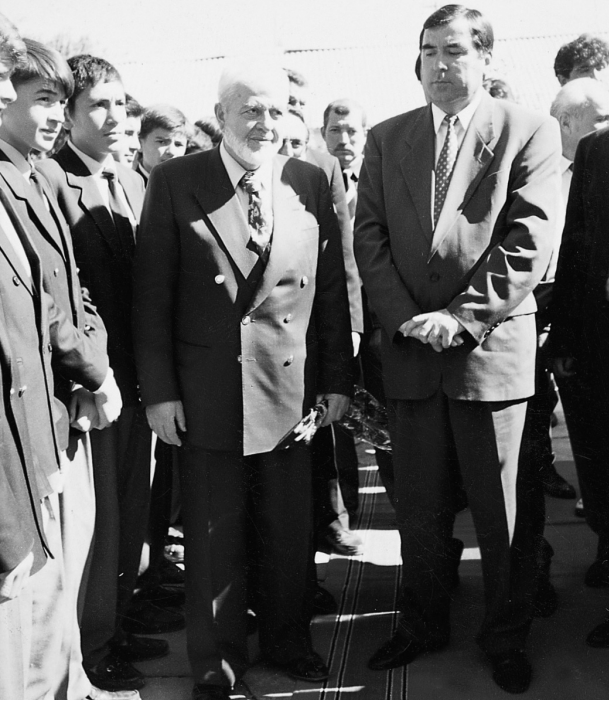
Hacı Kemal Erimez, bir okul ziyareti sırasında Tacikistan Cumhurbaşkanı İmamali Rahmanov ile